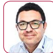
Mehmet Ermis Zahoransky AG