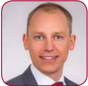
Josef Neuer Kraiburg TPE GmbH & Co.KG