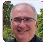
Sven SchroebeL Röhm GmbH