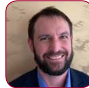
Peter Störi Sax Polymers Industrie AG